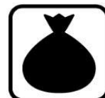
敷地内ゴミ置き場